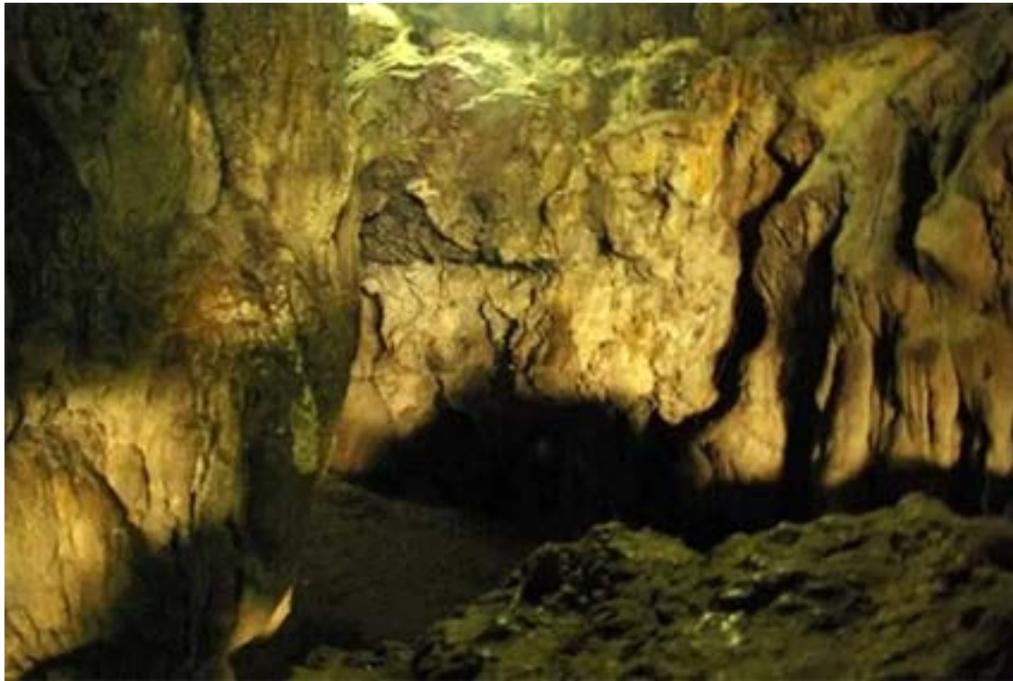
Grottes de Mawsmai (Meghalaya Nord-Est de l'Inde)

Texte : Nabanita Deshmukh Illustrations : Phidi Pulu Traduction : Sandrine Chabannes