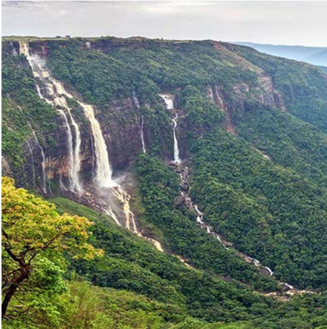
(Meghalaya Nord-Est de l'Inde)