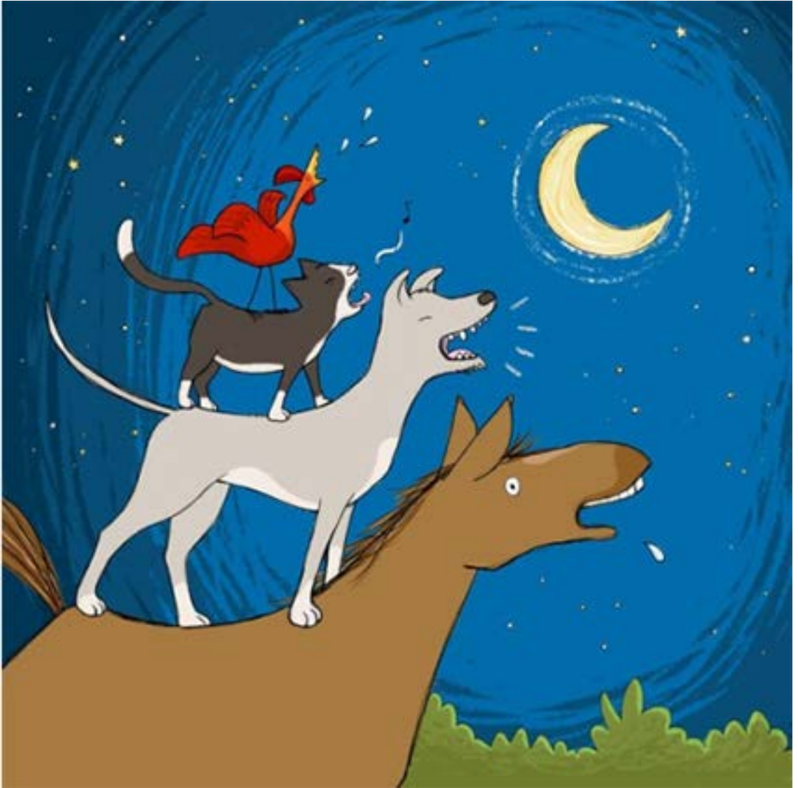
Le vieux coq